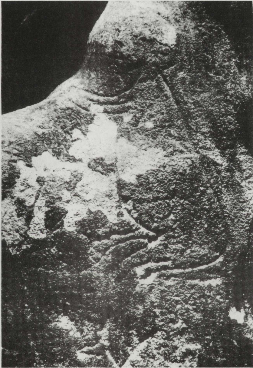
Fig. 1. Homme ithyphallique de Saint-Cirq (Dordogne) : la tête ronde est cernée d'un trait gravé ; l'oeil et l'oreille sont faits de deux petits cercles gravés ; le nez et le front sont évoqués par des reliefs naturels.