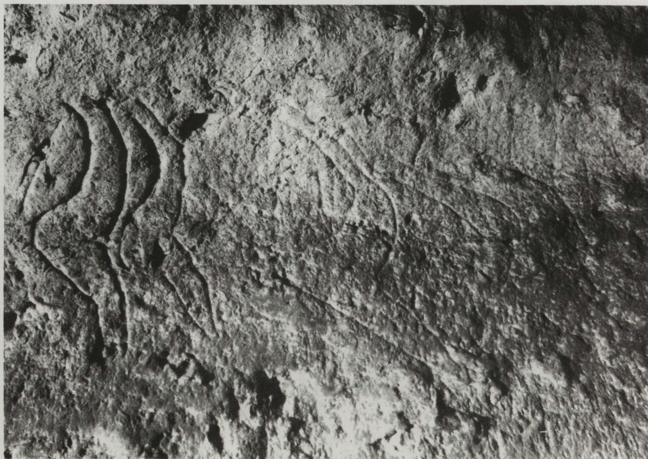
Fig. 4. Cinq F.F.S. de Fronsac (Dordogne), représentées à des stades différents de la schématisation, depuis la plus complète à gauche (où le triangle pubien est figuré), jusqu'à des aspects hâtifs à droite, où n'apparaît plus que le tronc.