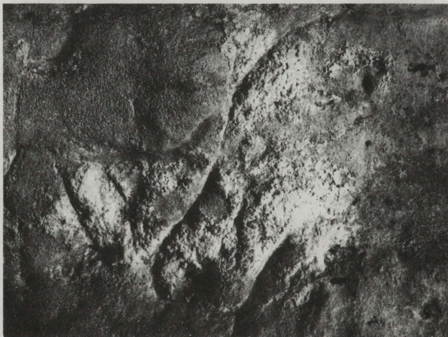
Fig. 2. Tête humaine bestialisée de la grotte de Comarque (Dordogne), gravée en face du grand cheval : le nez est allongé en mufle ; un aspect semblable est observé sur un personnage humain de la grotte des Combarelles.