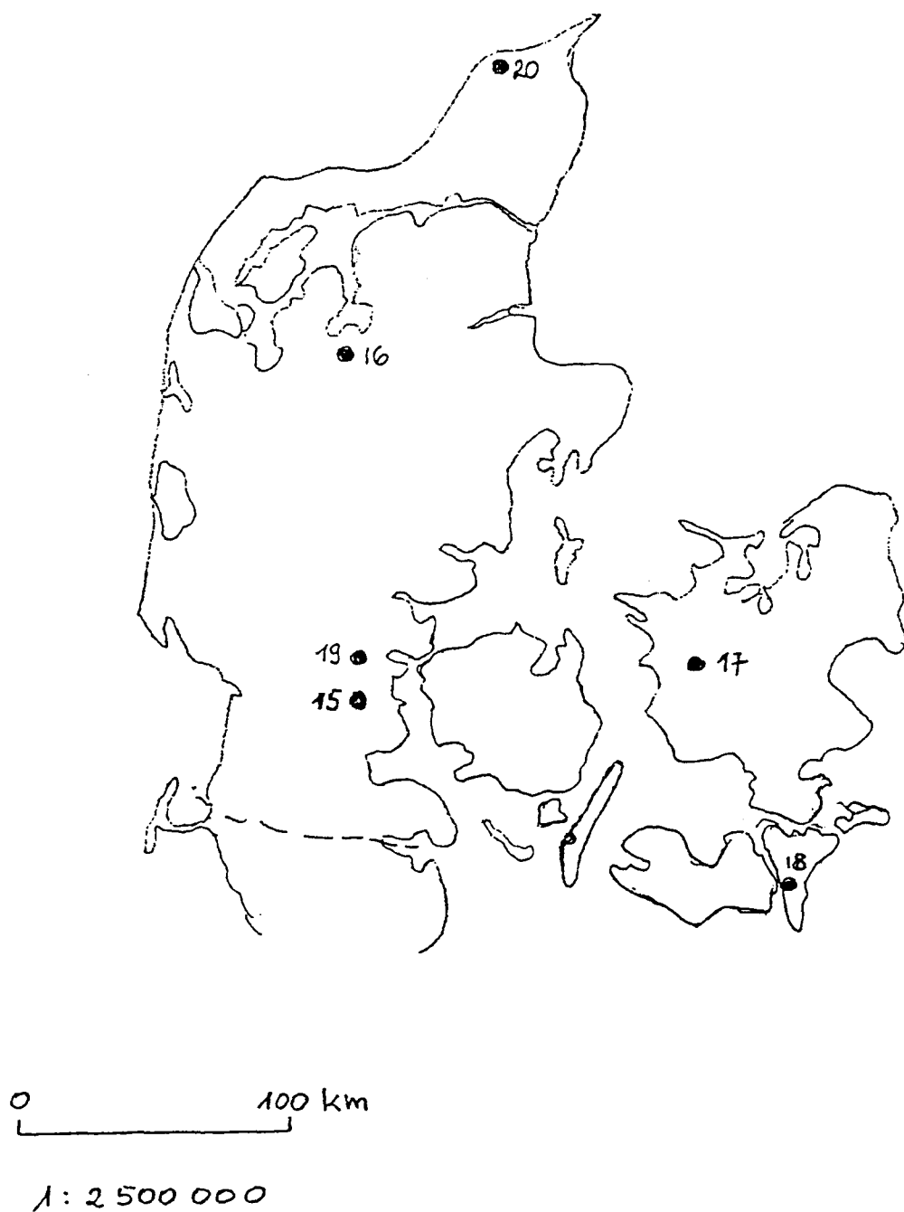
Carte 2 : Danemark