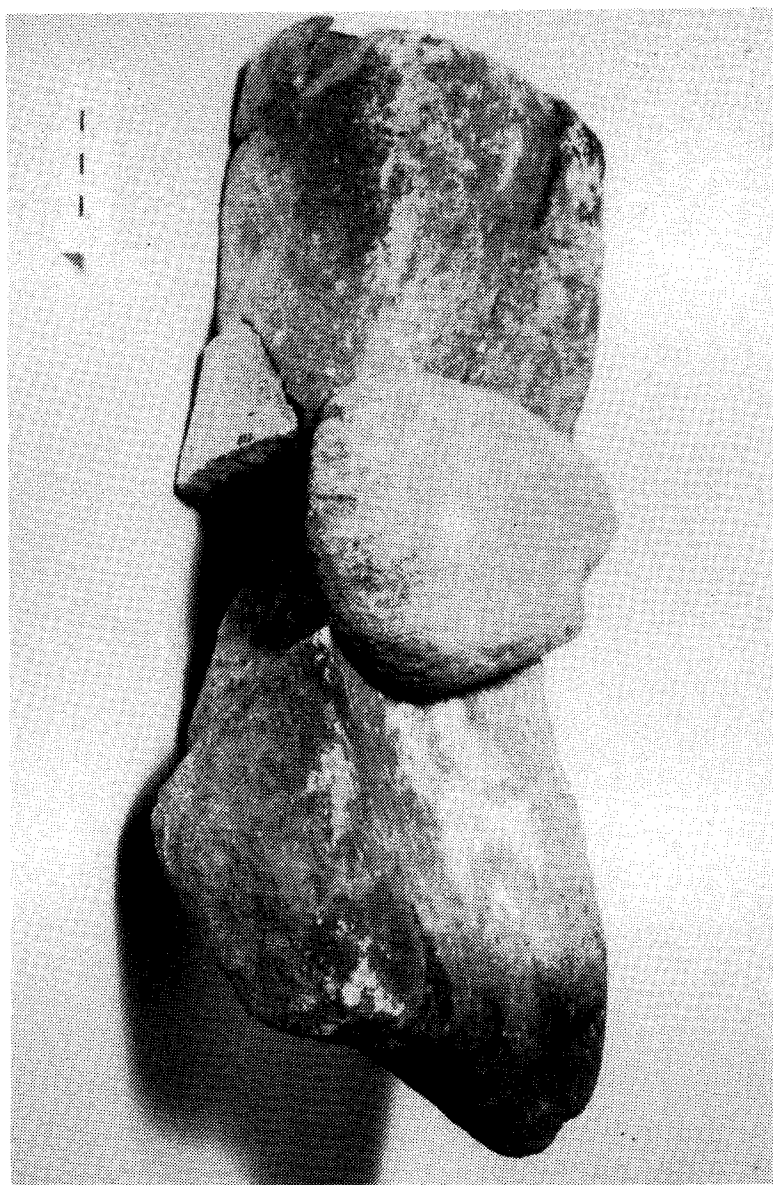
Photo 1 - Niveau 11 - Meule et mollete