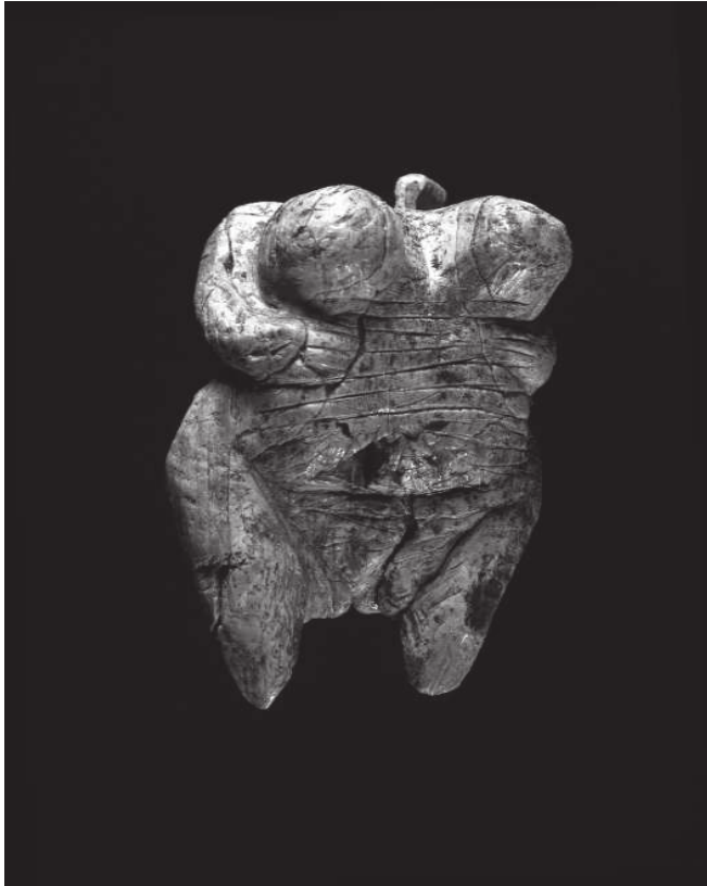
Figure 1 : La « vénus » du Hohle Fels près de Schelklingen, ivoire, trouvée dans le niveau Vb, niveau inférieur de l'Aurignacien de ce site.

témoignant d'un sentiment esthétique et d'activités rituelles au Paléolithique ancien et moyen ainsi qu'au cours du MSA (Middle Stone Age) africain, il paraît que la phase de l'Aurignacien entre 40.000 et 30.000 ans ne constitue pas un moment quelconque de l'histoire de l'humanité. Du point de vue de la rapidité de conception d'objets témoignant d'un ordre symbolique et d'un système rituel portés par la société entière, l'Aurignacien se distingue des phases précédentes. (...)».