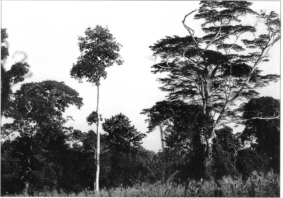
Photo 3. Lisière de l'îlot de forêt marécageuse.

La grande majorité des observations ont été réalisées entre janvier 94 et juin 95 au moyen de jumelles (10X) et d'une longue vue (30WX). Quelques-unes sont antérieures à cette période (octobre 91 à décembre 93).