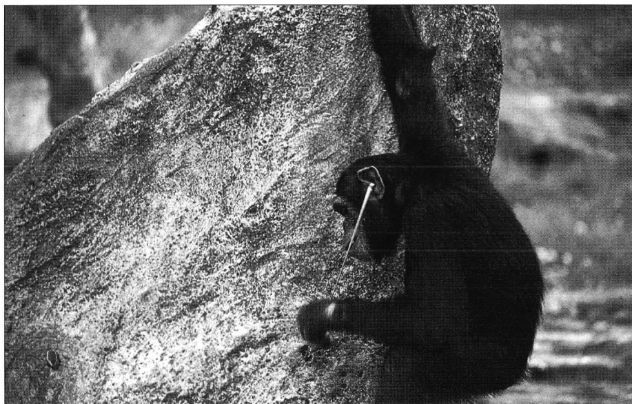
Photo 4. Au zoo de San Diego, on tente de tromper l'ennui des primates captifs en leur offrant la possibilité de « pêcher aux termites », un comportement fréquent dans la nature.

At the San Diego Zoo, to return some control over their environment to the animals, chimpanzees are allowed to fish for termites, thus becoming more « complete » animals.