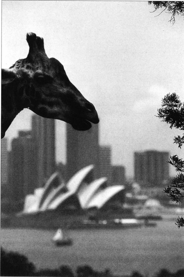
Photo 5. Quoi qu'ils fassent, les zoos restent des lieux où l'animal est coupé de son environnement évolutif.

animal qui lui sont proposées. Si nous continuons à proposer au public des animaux-objets au sens de HEDIGER, il n'y a aucune raison pour que le visiteur perçoive, ni même imagine, ce que peut être un animal complet dans son environnement évolutif. Parce qu'il ne pourra percevoir les animaux qu'à travers des interactions typiquement humaines du type de celles que nous avons décrites dans la première partie, le visiteur n'aura qu'une idée fautive de ce qu'il y a à protéger, et continuera d'entretenir des conceptions complètement fausses sur les animaux qu'il vient voir.