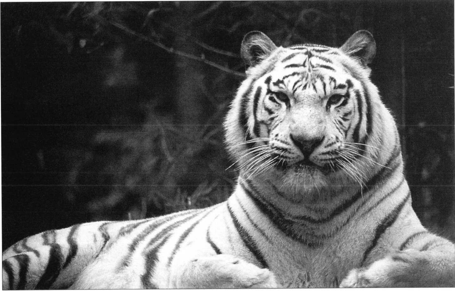
Photo 2. Ce tigre de Sibérie, d'une valeur d'exhibition considérable, ne cesse de voyager d'un zoo à l'autre. Partout on espère qu'il drainera les visiteurs.

Zoos know that the exhibition value of an animal rests an irrational motive.