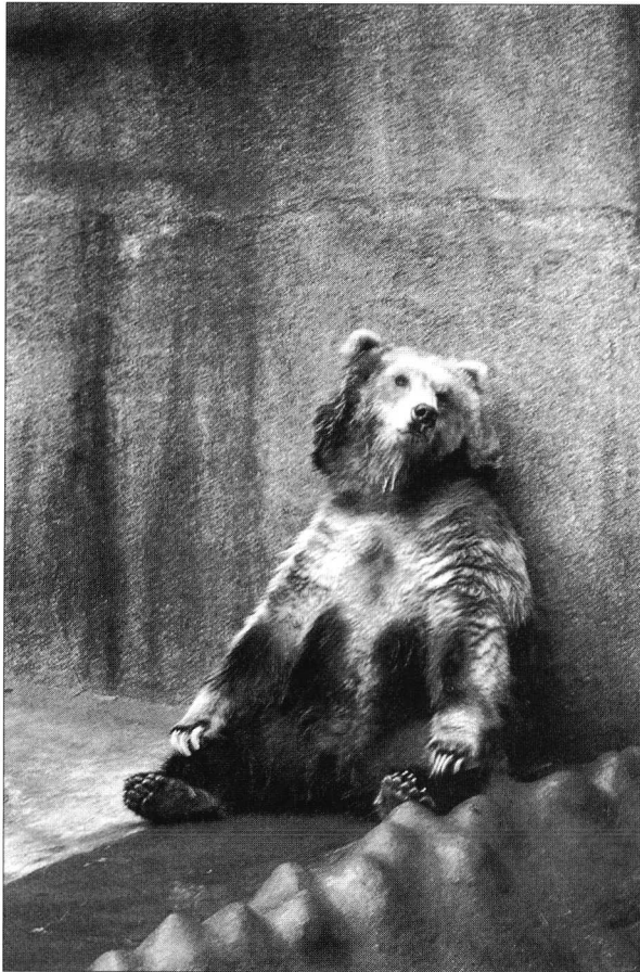
Photo 1. Un ours dans sa fosse, image d'un rapport de domination.