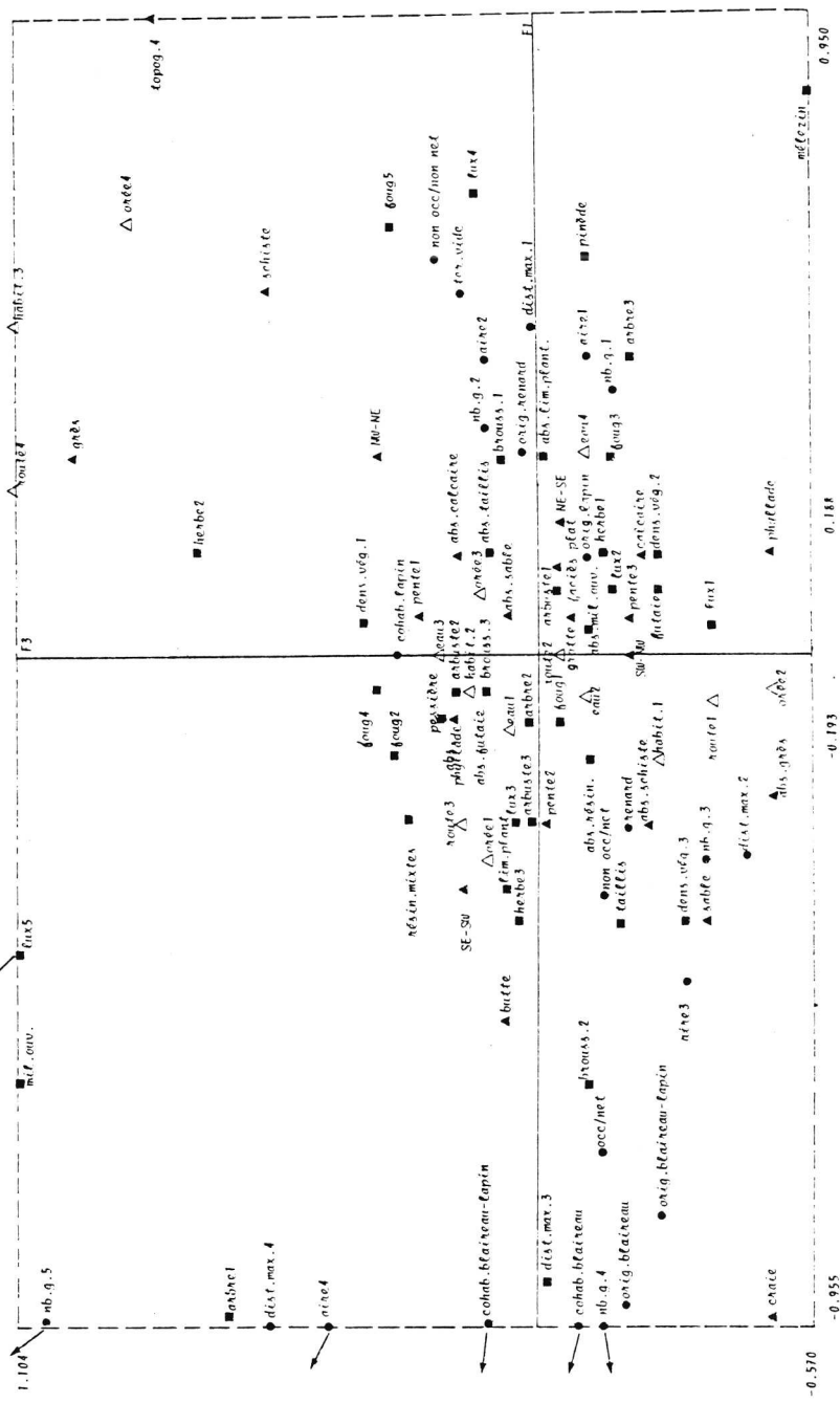
Figure 3. : Plan F1, F3 : projection des variables. Les valeurs des indices caractérisant les variables se rapportent aux modalités (classes) de ces variables (voir tableau 1). abs : absence.