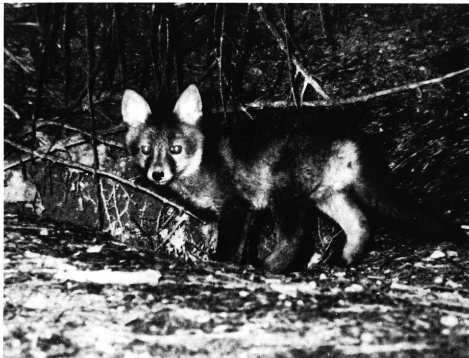
Renardeau devant le terrier.